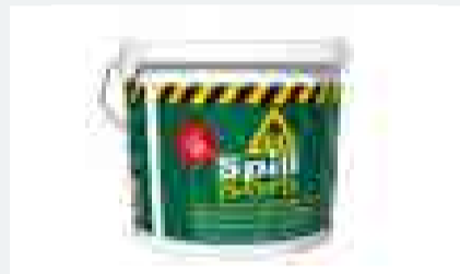
Eimer 2,8 kg absorbiert 20 l Schadstoffe

Ländern vertreten. Mit dem Vorstoss in den Schweizer Markt erfüllt dieses Produkt die Auflagen und Anforderungen betreffend Schutz natürlicher Ressourcen, Umwelt und Sicherheit. Ölbindemittel werden überall eingesetzt: Vorgeschrieben sind sie nicht nur bei der Polizei, der Feuerwehr, allen Immobilienverwaltungen, Gemeinden, Tankstellen und Garagen, sondern auch bei Kleinbetrieben wie mechanischen Werkstätten und ähnlichen Unternehmen.