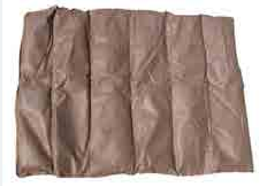
Matten in verschiedenen Grössen, sie eignen sich für unzählige Anwendungen

Das aus Kanada stammende Naturprodukt Spillsorb ist in der Schweiz bereits seit einigen Jahren ein Geheimtipp unter den Ölbindemitteln. Dieses wird vor allem in der Industrie eingesetzt. Seit 2015 sind jedoch erstmals auch kleinere Gebindegrössen im Verkauf, was eine Erweiterung des Kundenstamms auf KMUs und Privatindustrie ermöglicht. Spillsorb ist eines der weltweit wenigen Öl- und Chemiebindemittel, das nicht nur zu 100% aus biologischem Ursprung stammt, sondern auch zu 100% biologisch abbaubar ist.