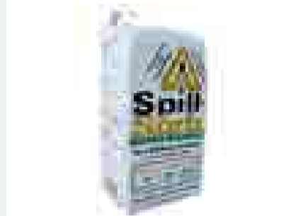
Gebinde 23 kg, absorbiert 200 l Schadstoffe

Bisher mussten Ölunfälle mit chemischen Produkten, meist Granulaten, gebunden werden. Diese haben den Nachteil, dass sie bei Nässe nicht funktionieren, brennbar sind und teuer entsorgt werden müssen – und damit vor allem die Umwelt belasten (chemischer Abfall). Nicht so Spillsorb! Dieses Produkt ist ein absolut natürliches, 100% organisches, nichttoxisches, laborgetestetes und in der Praxis bewährtes Absorptionsmittel. Spillsorb ist das Produkt des gleichnamigen kanadischen Unternehmens. In Nordamerika, Asien, Afrika, Ozeanien, Zentral- und Südamerika ist es bereits seit mehreren Jahren im Markt; in Europa ist Spillsorb in elf